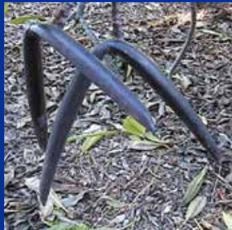
花の種類により形や大きさも少しずつ違います。通常ブーメランのように2又になっていますが、不規則的に1つのももあります。