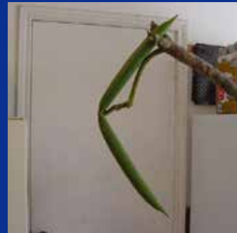
冬に休眠している間（完全に水を断った状態）でもシードポッドは生長を続けます。