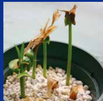
通常の培養土にウイング（羽）の部分を外に出し土中に植えます。発根するまでは水分を切らさずにします。1～2週間程度で発芽します。