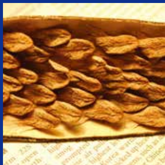
ある日突然殻は茶色く乾燥し、中央から半分に割れます。割れた殻の中には種がびっしりときれいに並んでいます。