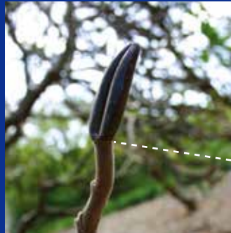
白や黄色の花はグリーンのシードポッド。ピンクや赤系の花はブラウンのシードポッドができます。