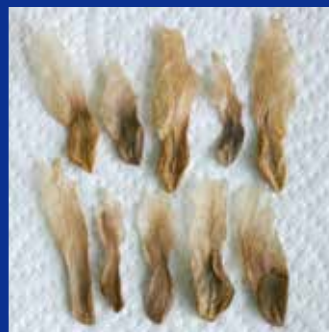
シードポッドの大きさや形がいろいろあるように、種の形も大きいものや丸みを帯びたものなど、様々です。