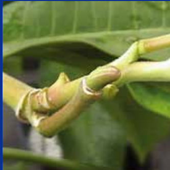
種が出来てまだ数日のシードポッド。毎日見るたびに大きくなっていくのがわかります。

花もそろそろ終わりを迎える夏の終わり頃、戸外にだしばなしのプルメリアに、自然受粉によって出来た豆粒サイズの「プルメリアの種／シードポッド」を見つけることがあります。シードポッドを見つけたら、種を収穫するまで見守ってみましょう。すくすくと大きくなっていき、9～10ヶ月近くで殻が開き種が見えます。