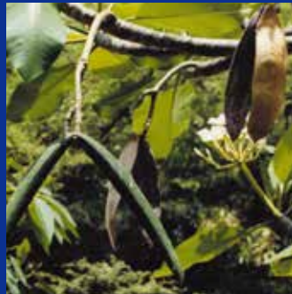
写真左下は十分に大きくなったシードポッド。右上にはすでに殻が開いて種が飛び散った後のシードポッドが見えます。